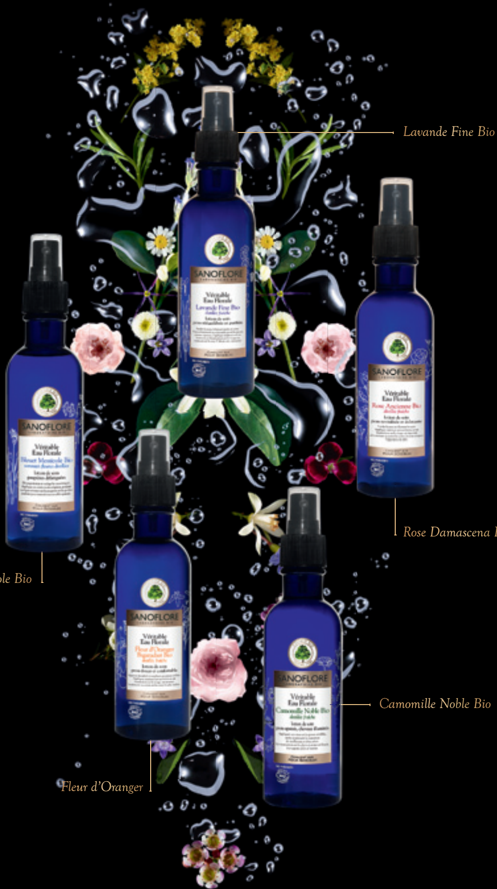
Lavande Fine Bio