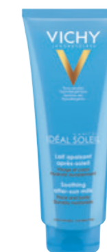
AFTER SUN SOOTHING AFTER-SUN MILK 300ml