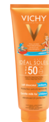
GENTLE MILK FOR CHILDREN SPF50 300ml