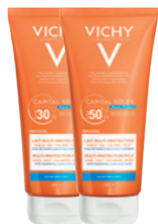
MULTI-PROTECTION MILK SPF30 & SPF50+ 200ml