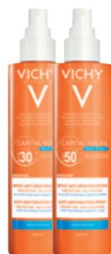
ANTI-DESHYDRATION SPRAY SPF30 & SPF50+ 200ml