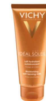
MOISTURIZING SELF-TANNING MILK 100ml