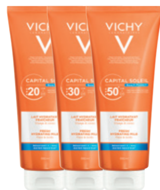
FRESH HYDRATING MILK SPF20, SPF30, SPF50+ 300ml