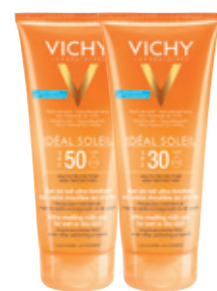
ULTRA-MELTING MILK-GEL FOR WET OR DRY SKIN SPF30 & SPF50 200ml