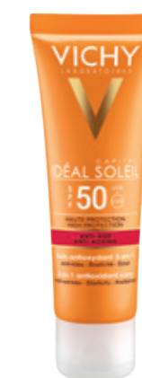
ANTI-AGEING - 3 IN 1 ANTIOXIDANT CARE SPF50 50ml