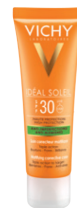
ANTI-BLEMISHES - MATTIFYING CORRECTIVE CARE SPF30 50ml