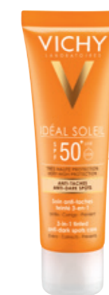
ANTI-DARK SPOTS - 3 IN 1 TINTED CARE SPF50 50ml