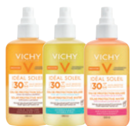
SOLAR PROTECTIVE WATERS Enhanced tan SPF30, Hydrating SPF30, Antioxidant SPF30 200ml