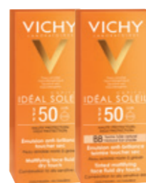
MATTIFYING FACE FLUID DRY TOUCH SPF30 & SPF50 50ml