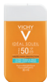
ULTRA LIGHT & FRESH POCKET SPF50 30ml