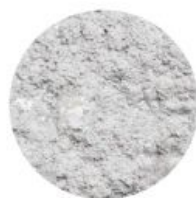
[ ARGILE ]