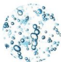
[ PANTHÉNOL ]